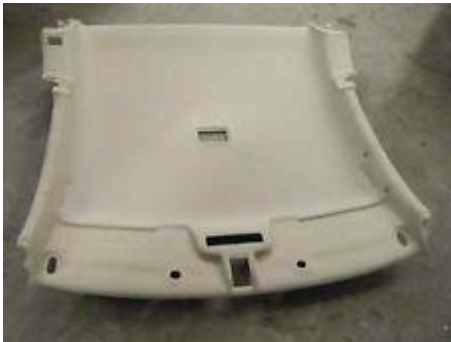
自動車ヘッドライナー

Cosmonate CG-2507N は自動車内装材であるヘッドライナー(天井材)の製造向けに作られた製品で、圧縮強度や曲げ強度などの機械的物性と脱型性、断熱性の面でも優れている。